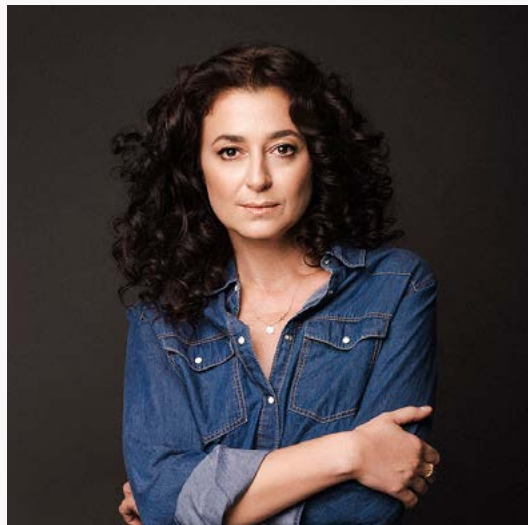
Ece Temelkuran.