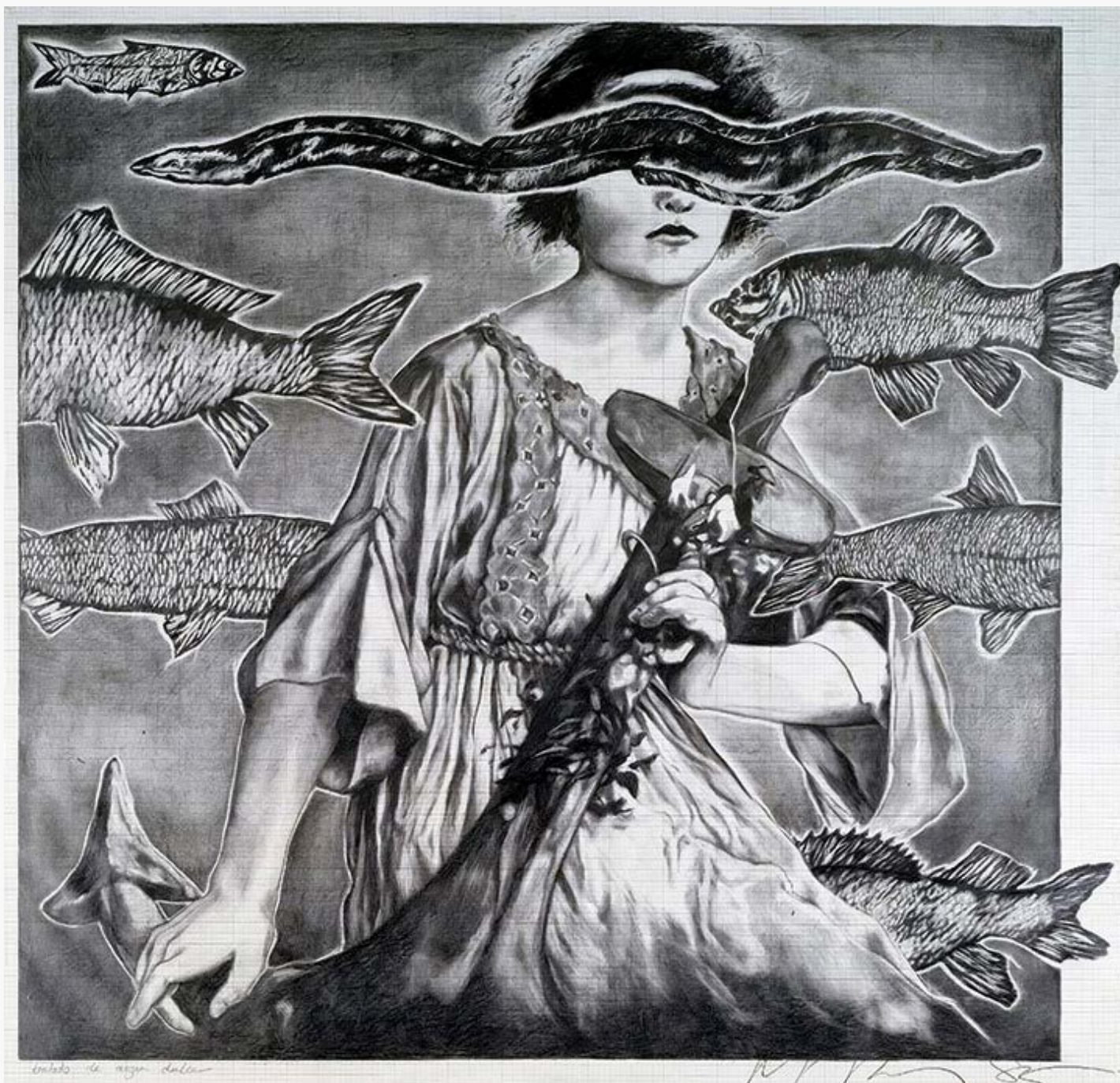
Tratado de agua dulce , grafito sobre papel milimétrico, 1985.