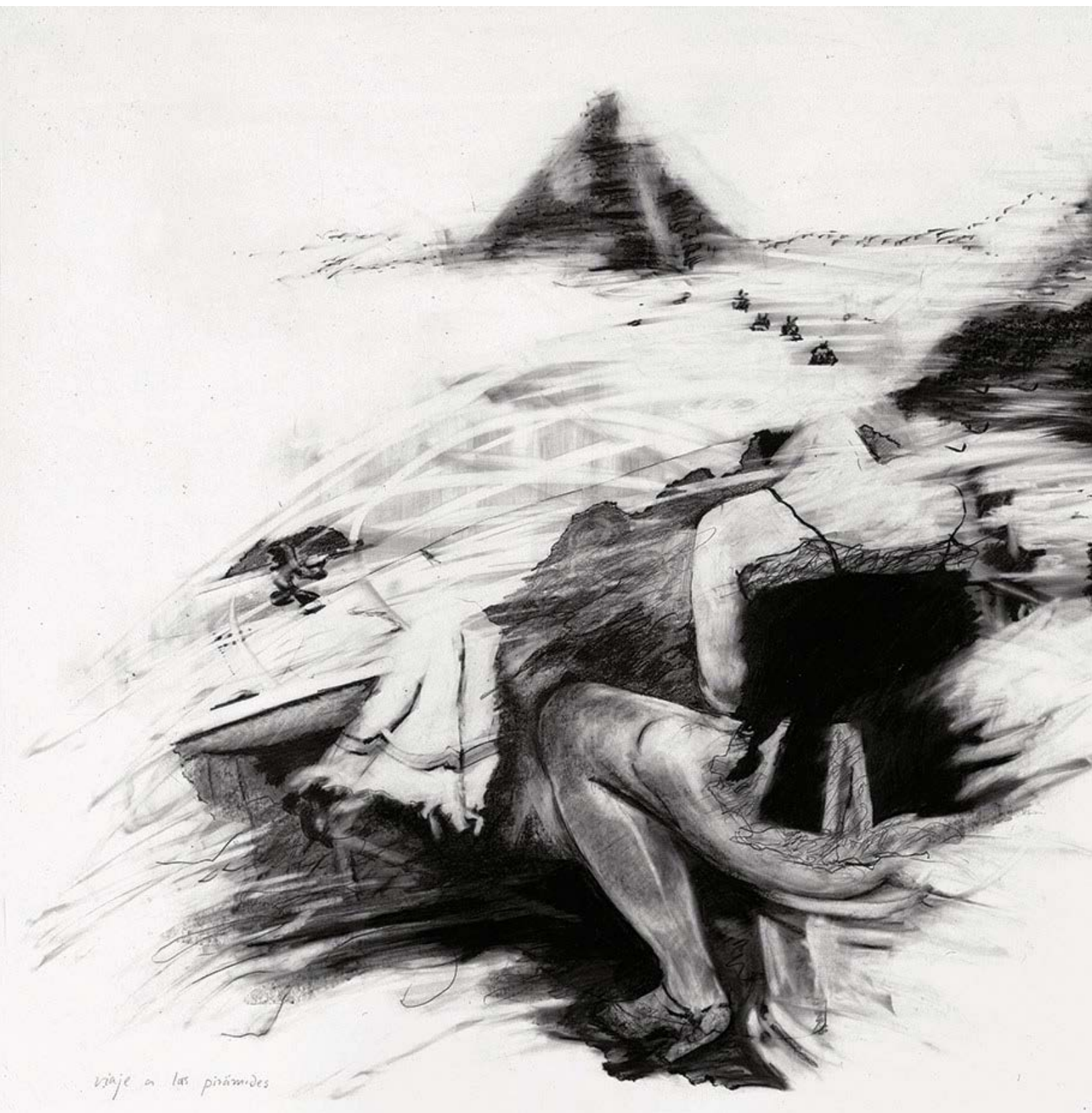
Viaje a las pirámides, grafito sobre papel, 1985.